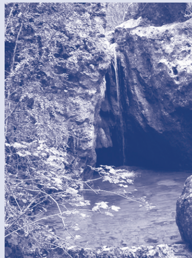
ARROYO DEL HORCAJO

Tras descender por una empinada cuesta de unos 100m. y siguiendo el sendero, podremos contemplar el río Tajo desde su margen izquierda hasta llegar a una pequeña pradera que da vistas a un remanso del río poblado de mimbreras silvestres.