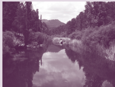
PASARELA DE PESCADORES

Llegamos a una pasarela de pescadores que nos permitirá cruzar el Tajo y tomar la pista principal. Merece la pena realizar un descanso y contemplar el río y su vegetación de ribera asociada, donde fácilmente podremos observar multitud de pajarillos como pinzones, mitos, carboneros, e incluso algunas especies típicas del pinar cercano como piquituertos, herrerillos capuchinos y carboneros garrapinos que acuden aquí a beber.