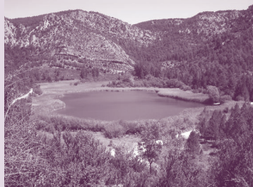
LAGUNA DE TARAVILLA

La ruta comienza en el aparcamiento de la Laguna de Taravilla . Esta laguna, también denominada de La Parra, se originó debido a los acúmulos tobáceos de origen calizo que ha ido depositando el arroyo que la alimenta, creando un embalsamiento natural. En esta laguna cría todos los años alguna pareja de ánades reales, así como pollas de agua y algún rascón. Todas ellas